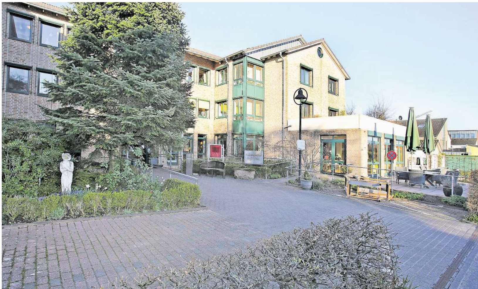
Verschlossene Türen: Auch das Seniorenzentrum St. Anna in Hoengen darf von Ehrenamtlern und Angehörigen nicht mehr betreten werden.

ALSDORF Die Bewohner von Seniorenheimen sind von der Corona-Krise in besonders perfider Weise betroffen. Einerseits können sie ihr Zuhause ohnehin meist nicht ohne fremde Hilfe verlassen, leben also ohnehin Tag für Tag mit der Einschränkung, die Jüngere dieser Tage als ungeheure Einschränkung empfinden. Andererseits sind sie aufgrund ihres Alters und von Vorerkrankungen einer besonders hohen Gefährdung durch Covid-19 ausgesetzt. Die Konsequenz: Zunächst galt gemäß Landeserlass ein eingeschränktes Besuchsverbot. Und seit dem Wochenende ist überhaupt kein Kontakt mehr erlaubt, der zum Überleben nicht notwendig ist – was den Besuch durch Angehörige unmöglich macht. Yvonne Kersgens leitet für die Aachener Caritasdienste (ACD) kommissarisch das Haus St. Anna in Alsdorf Hoengen. Jan Mönch hat mit ihr gesprochen.